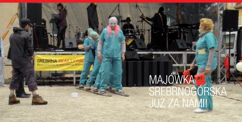
MAJÓWKA SREBRNOGÓRSKA JUŻ ZA NAMI!